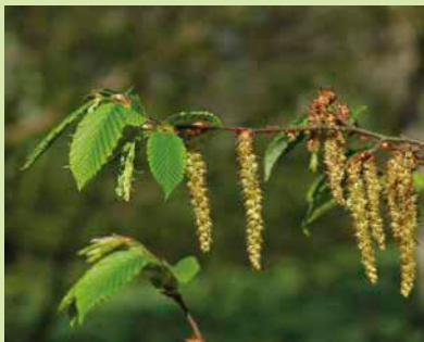
Weibliche und männliche Blüten der Hainbuche

Es war nicht zu übersehen: Die Blütenstaubwolken sind heuer im Frühjahr ausgeblieben. Unser Wald, egal ob Nadel- oder Laubwald, hat nur sehr wenig geblüht. Nachdem im letzten Jahr fast alle Baumarten fruktifiziert hatten, haben alle »Insider« mit dieser Flaute gerechnet. Eine Ausnahme bilden lediglich Hainbuche und Linde. Hier wird auf nennenswerte Saatgutmengen im Herbst gehofft. Mit etwas Glück könnten vereinzelt auch kleine Ernten bei Weißtanne im Bayerischen Wald gelingen. Ähnlich gestaltet sich die Lage bei den Eichen- und den Ahornarten. Hier sind höchstens ganz vereinzelt kleinere Sammelaktionen zu erwarten.