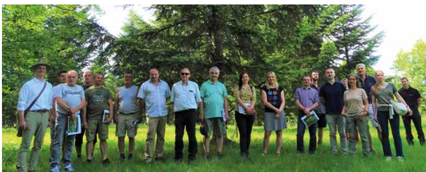
Die Kolleginnen und Kollegen vom BFW Wien und AWG Leiter und Mitarbeiter auf der Weißtannen-Samenplantage in Laufen-Penesöd