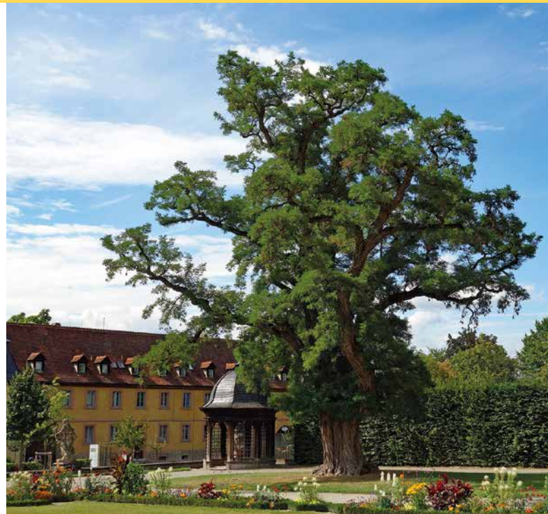
1 Ein »Park«-Baum par excellence ist die alte Robine vor dem Veitshöchheimer Schloss (oben), forstwirtschaftlich wesentlich interessanter sind Robinien mit möglichst geradschaftigen Stämmen (re.)

Dazu produzierten die Organisatoren der LWF selbst ein 18-minütiges Video. Dirk Schmechel, Abteilungsleiter an der LWF und zuständig für Wissenstransfer, Öffentlichkeitsarbeit und Waldpädagogik,