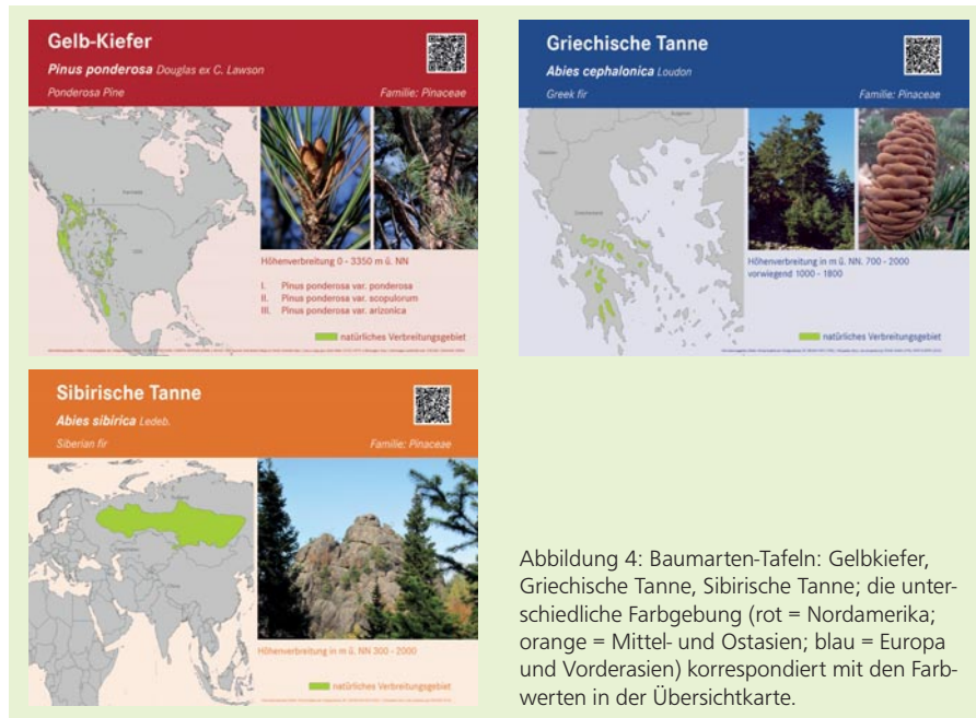
Abbildung 4: Baumarten-Tafeln: Gelbkiefer, Griechische Tanne, Sibirische Tanne; die unterschiedliche Farbgebung (rot = Nordamerika; orange = Mittel- und Ostasien; blau = Europa und Vorderasien) korrespondiert mit den Farbwerten in der Übersichtskarte.

In der Mitte des Weltwaldes befindet sich ein größerer Pavillon. Er bietet Raum für wechselnde Ausstellungen rund um die Themen Wald, Ökologie und internationale Forstwirtschaft (Abbildung 4). Mehrere Künstlersymposien haben in den vergangenen Jahren Skulpturen aus Holz hinterlassen. Sie machen den Weltwald als Ausflugsort attraktiv, auch für Besucher, die sich zunächst weniger für die Bäume interessieren.