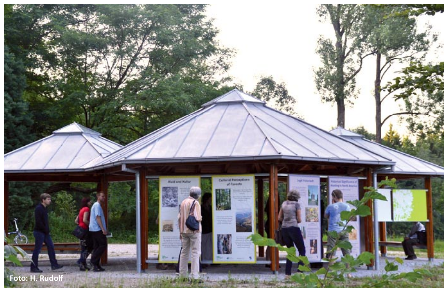
Abbildung 5: Zentralpavillon

In die gleiche Richtung zielt die noch in Planung befindliche Konzeption der Themengärten. An drei ausgewählten Plätzen – passend zur Gliederung nach Kontinenten – sollen erlebnisorientierte Angebote entstehen, die mit den kulturellen Aspekten der Baum-Heimatländer in Berührung bringen. Im Fokus stehen dabei weniger wissenschaftliche Fragen als vielmehr die Ansprüche von Familien mit Kindern an ein spannendes Ausflugsziel.