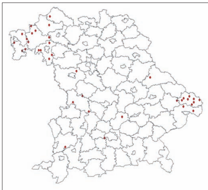
Abb. 1: Geografische Verteilung der gemeldeten Hantavirusfälle in Bayern 2010. In diesem Jahr sind in den Melde- wochen 1-13 bereits 38 Hantaviruserkrankungen gemeldet worden (Stand: 13.04.2010).

Freyung-Grafenau, Main-Spessart und Würzburg betroffen sind (Abb. 1). Diese drei Landkreise sind bereits seit mehreren Jahren als Gebiete bekannt, in denen gehäuft Hantavirusinfektionen auftreten.