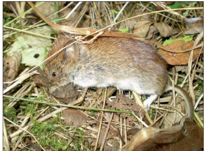
Abb. 3: Rötelmaus ( Myodes glareolus Schreber, 1780)

Die Mäuseprognose der LWF im Herbst 2009 ergab eine weiterhin hohe Ausgangsdichte forstschädlicher Mäuse in Mittel- und Oberfranken, sowie in Schwaben und im westlichen Oberbayern. Auch in den Prognoseflächen in Niederbayern wurde der Dichteindex von 10% belegten Fallen/Fangnacht überschritten. Die gemeldete Schadfläche 2009 fiel jedoch dazu verhältnismäßig gering aus. Vermutlich führte die lange Schneelage im Winter 2009/2010 dazu, dass die tatsächlichen Schäden erst nach dem Meldetermin zum 01.03. sichtbar wurden und sich somit in der in Abbildung 2 gezeigten Statistik für 2009 nicht widerspiegeln. Der warme und trockene August/September 2009 und die starke Fruktifikation der Buche, teilweise auch der Eiche, führten auch in Bayern zu guten Ausgangsbedingungen für das Überwintern der Mäuse. Wir rechnen für 2010 mit einer Zunahme der Mäusepopulation und somit der Fraßschäden.