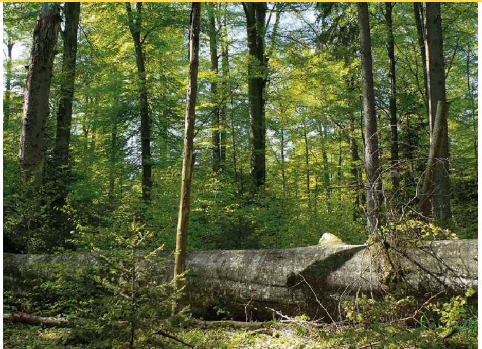
4 Das Belassen von Totholz im Wald ist aktiver Naturschutz; die Verwendung öffentlicher Gelder für Maßnahmen dieser Art stoßen auf breite Unterstützung bei den Befragten

ist, anstelle von einzelnen Maßnahmen die tatsächlichen Leistungen der Forstwirtschaft für den Klima- und Biodiversitätsschutz sowie für Erholungs- und Schutzleistungen zu honorieren. Die Agrarministerkonferenz (AMK) aus Bund und Ländern hat kürzlich die Auszahlung von öffentlichen Mitteln an Waldbesitzende beschlossen, um Anreize für den Erhalt und die Erweiterung der CO 2 -Speicherkapazität zu setzen. Hierfür soll der Klima- und Energiefonds genutzt werden, der sich unter anderem aus Einnahmen, die Energiewirtschaft und Teile der Industrie für den Ausstoß von CO 2 zahlen müssen, finanziert. Die AMK reagiert damit auf eine Forderung von Waldbesitzerverbänden, zusätzliche Einnahmemöglichkeiten zu schaffen (vgl. Eberl 2022).