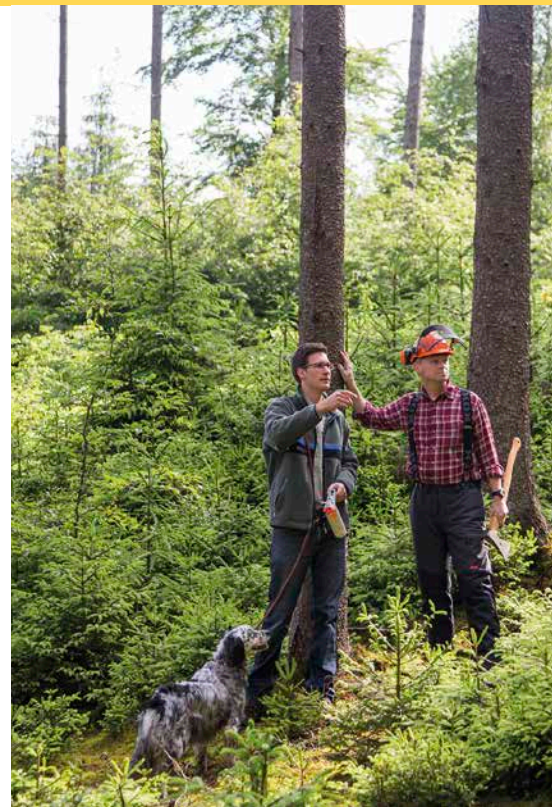
1 Besprechung einer Hiebsmaßnahme im Wald; aus Sicht eines Großteils der Bevölkerung dient die Bewirtschaftung des Waldes dem Erhalt dessen vielfältiger Leistungen. Doch wer soll für die Bewirtschaftungskosten aufkommen?

Interessanterweise sind 50 % der Befragten mit einem klaren »Ja« davon überzeugt, dass Verkehr und Industrie für die Kosten bei der Waldbewirtschaftung aufkommen sollten. Verantwortung für die Waldbewirtschaftungskosten wird somit tendenziell eher bei den Produzenten von CO 2 gesehen. Das Verursacherprinzip