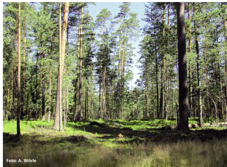
Abbildung 1: Der Kiefernbestand von Süden