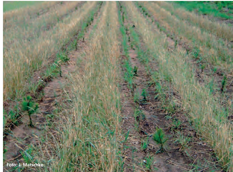
Abbildung 2: Der Schatten spendende Anbau von Getreide zwischen den Reihen wirkt ausgleichend auf die Bodentemperatur.

Bäume, die einer Stressbelastung ausgesetzt sind, aktivieren Phytohormone (Abscisine, Jasmonate, Äthylen), die die Alterung der Pflanzen bedingen. Sie sind unter anderem dafür verantwortlich, dass die Spaltöffnungen zu früh geschlossen werden und die Zellen zu schnell altern. Die Meristeme werden unzureichend ausgebildet, die Ruhephase wird vorzeitig eingeleitet. Eine Stressbelastung der Zellen führt auch zu einer Verminderung der in den Wurzeln gebildeten physiologisch aktiven Cytokinine, jedoch nicht ihrer Speicherformen. Cytokinine nehmen eine Schlüsselfunktion bei den Wachstums-, Induktions- und Ausdifferenzierungsprozessen ein. Eine unzureichende Konzentration physiologisch aktiver Cytokininformen reduziert Zahl und Ausbildung von Haupt- und Seitenknospen und hemmt oder verhindert den Knospenaustrieb im Frühjahr. Ursache des Cytokininmangels ist ein gestörtes und vor allem verzögertes Wachstum der Wurzelspitzen.