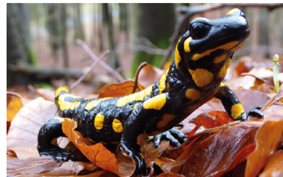
Mit seiner schwarzglänzenden Haut und der gelben Musterung ist der Feuersalamander unverwechselbar.

Feuersalamander können sehr alt werden. Im Freiland gibt es Nachweise von über 20 Jahre alten Tieren – in Terrarienhaltung können sogar fünfzig Jahre erreicht werden. Salamander sondern bei Gefahr aus den Ohr- und zahlreichen Rückendrüsen ein giftiges Sekret ab, das bei Kontakt mit anderen Tieren Speichelfluss, Brechreiz und sogar Krämpfe auslöst. Die Anzahl an Fressfeinden der erwachsenen Lurche hält sich dementsprechend in Grenzen. Anders verhält es sich bei den ungiftigen Larven. Sie werden unter anderem von Libellenlarven, Fischen, Wasserspitzmäusen, Wassermäusen, Singdrosseln und Amseln gefres-