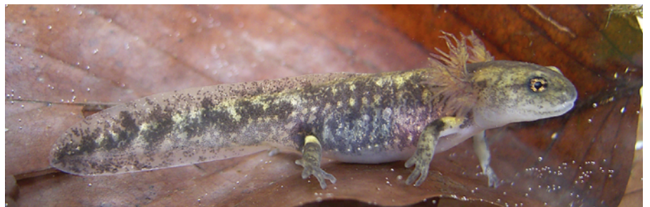
Feuersalamanderlarven erkennt man an den gelben Flecken am Ansatz der Gliedmaßen.

jahr erfolgen. Nach einer Entwicklungszeit im Mutterleib von acht bis neun Monaten setzt das Weibchen im Frühjahr – meist im April und Mai – über mehrere Nächte hinweg zwischen 20 und 50 Larven ins Flachwasser. Rund vier Monate verbringen die »Minisalamander« dort. Sie atmen zunächst über äußere Kiemen – verlassen dann aber nach der Metamorphose mit einer vollständig entwickelten Lunge für immer das Gewässer.