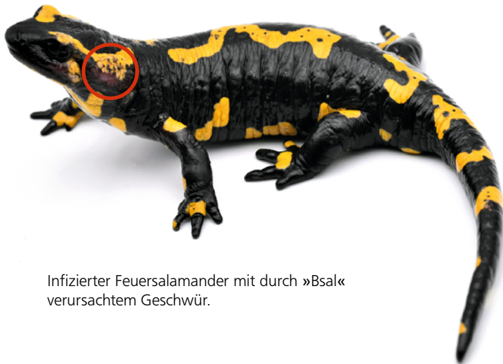
Infizierter Feuersalamander mit durch »Bsal« verursachtem Geschwür.

Um einen aktuellen Überblick zur Ausbreitungssituation in Bayern zu haben, werden durch das Landesamt für Umwelt und die Naturschutzverbände Bund Naturschutz, Landesbund für Vogel- und Naturschutz und Landesverband für Amphibien- und Reptilienschutz im Rahmen eines Artenhilfsprogramms in verschiedenen bayerischen Mittelgebirgen laufend Feuersalamander auf Pilzbefall getestet.