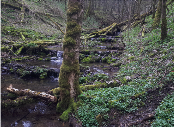
Feuersalamanderlarven halten sich bevorzugt in strömungsarmen und fischfreien Bereichen der Bachoberläufe auf.

Kleingewässer genutzt. Strukturen wie Steine, Totholz und Falllaub im Gewässer sind wichtige Versteckmöglichkeiten für die Larven und bieten Schutz vor Fressfeinden.