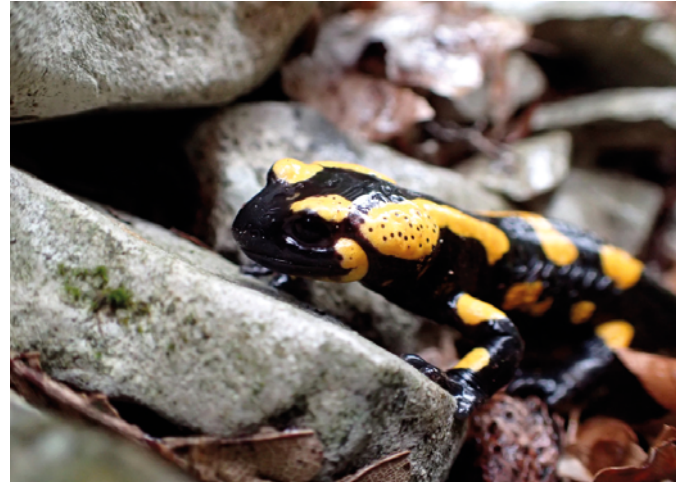
Spalten und Klüfte in Felsen oder Blockschutt sind wichtige Verstecke für adulte Feuersalamander.