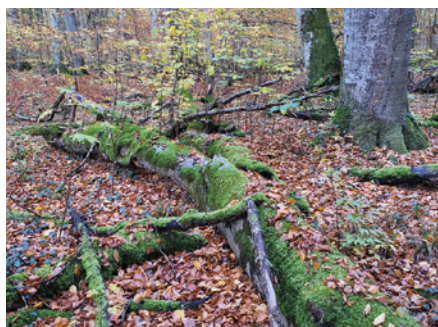
Liegendes Totholz bietet überlebenswichtige Verstecke im Feuersalamander-Lebensraum.

Der Lebensraum des Feuersalamanders sind artenreiche Laub- und Mischwälder im Umfeld von Quellen und Bachbereichen. Eine naturnahe Waldbestockung sollte hier erhalten bleiben.