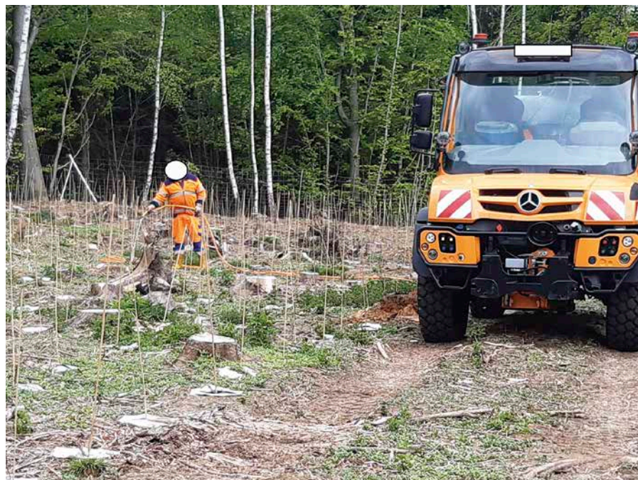
Schlauchbewässerung mit 2.000l Tank mit Stromaggregat und Tauchpumpe von der Rückegasse aus

Zwischenlagerung, die Sortimente und ganz wesentlich: die Qualität der Pflanzung. Wenn hier nicht fachgerecht und mit hoher Sorgfalt gearbeitet wird, wirft man mit einer Bewässerung gutes Geld oder rares Wasser schlechten und nicht überlebensfähigen Forstpflanzen hinterher. Auch waldbauliche Möglichkeiten wie die Nutzung von Naturverjüngung, Sukzession, Vorwald und Ergänzungspflanzung sollten ausgeschöpft werden.