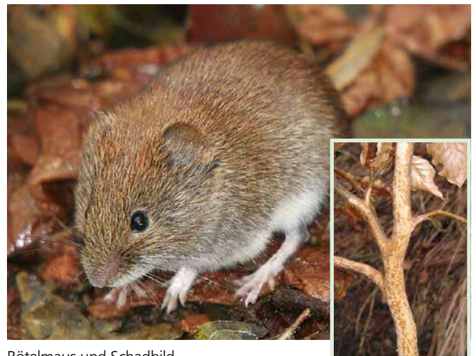
Rötelmaus und Schadbild

Massenvermehrungen der Rötelmaus wiederholen sich regelmäßig alle 3 bis 4 Jahre, insbesondere nach Buchenmastjahren. Sie kommt überall im Wald vor, vorzugsweise auf frisch vergrasteten Flächen, an Dickungsrändern sowie in Verjüngungen mit beerentragender Strauch- und Krautvegetation. Die Tiere legen kugelige Gras- oder Blattnester mit oberflächlich verlaufenden Gängen an.