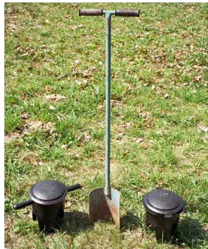
Köderstationen und Hohlspaten

Die Bekämpfung der Schermäuse erfordert eine Prognose. Dazu wird ein gefundener Schermaus-Gang etwa eine Spatenbreite weit aufgedigert. Wird der Bau bewohnt, ist die Öffnung spätestens am nächsten Tag geschlossen (verwühlt); Maulwürfe verschließen die Löcher erst innerhalb mehrerer Tage. Die Kritische Zahl liegt hier schon bei einem »verwühlten« Gang pro Fläche nach 24 Stunden!