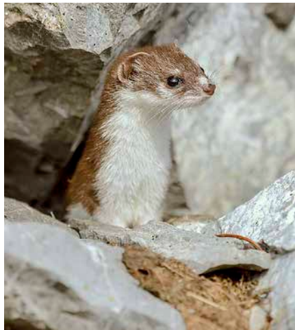
Das Mauswiesel ist ein wichtiger natürlicher Feind der Kurzschwanzmäuse

Bei regelmäßiger Anwendung ist das Ausmähen der Begleitvegetation eine gute Möglichkeit, den Aufbau einer erhöhten Mäusepopulation durch Entzug der Deckung und Nahrungsgrundlage zu