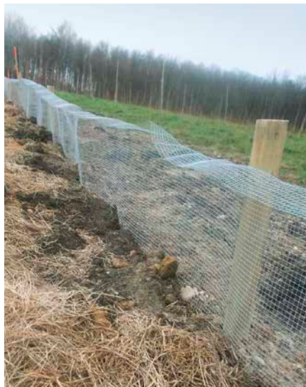
Schermauszäune verhindern wirksam eine Wiederbesiedelung

Vor dem Einbau der Köderstation muss geprüft werden, ob der Gang befahren ist (Verwühlprobe). Flachstreichende, an der Erdoberfläche aufgewölbte Gänge sind nicht geeignet. Die Station wird über dem Gang leicht in den Boden gedrückt. Dieser Abdruck wird mit dem Hohlspaten bis zum Schermaus-Gang aufgegraben. Die Station wird nun so unter leichtem Drehen in diesen Gang gedrückt, dass 1, besser 2 Einläufe der Station an den Schermaus-Gang anschließen. Überflüssige Erde wird aus der Station entfernt und der Gangboden etwas vertieft, damit die von der Schermaus aus dem Gang geschobene Erde die Köderstation nicht gleich wieder verschließt. Hohlräume zwischen Außenwänden und Boden müssen vorsichtig mit Erde gefüllt werden.