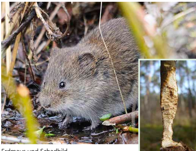
Erdmaus und Schadbild

Die Erdmaus neigt etwa alle 2 bis 4 Jahre zur Massenvermehrung. Sie lebt überwiegend in stark vergrasteten und durchsonnten Kulturen mit Grasmoderauflage, baut oberirdische Grastunnel und -nester, zum Teil auch kurze Erdgänge in lockeren anmoorigen Böden. Erdlöcher gräbt sie nur selten.