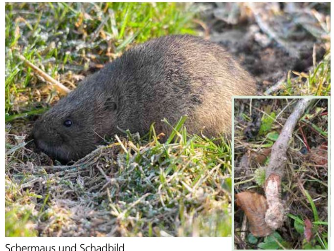
Schermaus und Schadbild

Vor allem in Erstaufforstungen kann es zu Schäden durch einwandernde Schermäuse aus angrenzenden landwirtschaftlich genutzten Flächen kommen. Die Schermaus legt flach unter der Erdoberfläche verlaufende Gänge an, die sich beim Verdrängen der Erde aufwölben.