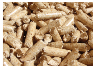
Drei verschiedene Formen des Energieträgers Holz: Scheitholz, Holz hackschnitzel und Pellets