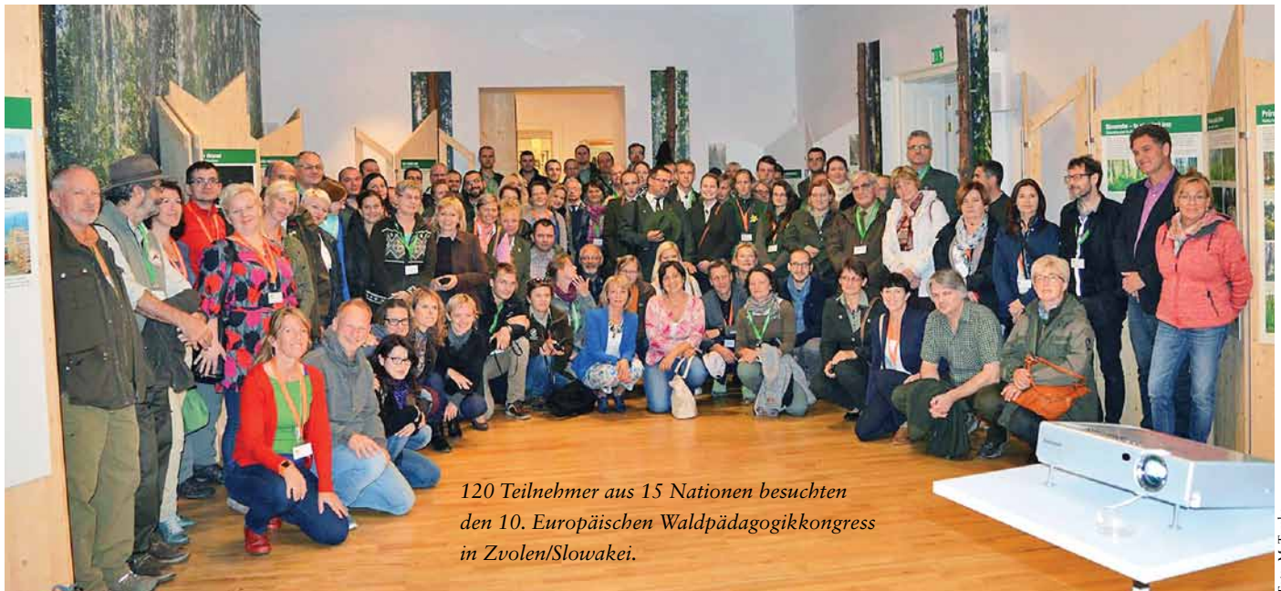
120 Teilnehmer aus 15 Nationen besuchten den 10. Europäischen Waldpädagogikkongress in Zvolen/Slowakei.

140 Teilnehmer aus 15 Staaten diskutierten darüber, wie die zukünftigen Herausforderungen, vor denen die Waldpädagogik steht, gemeistert werden und wie Waldpädagogen die höheren Stufen einer Bildung für Nachhaltige Entwicklung (BNE) erklimmen können.