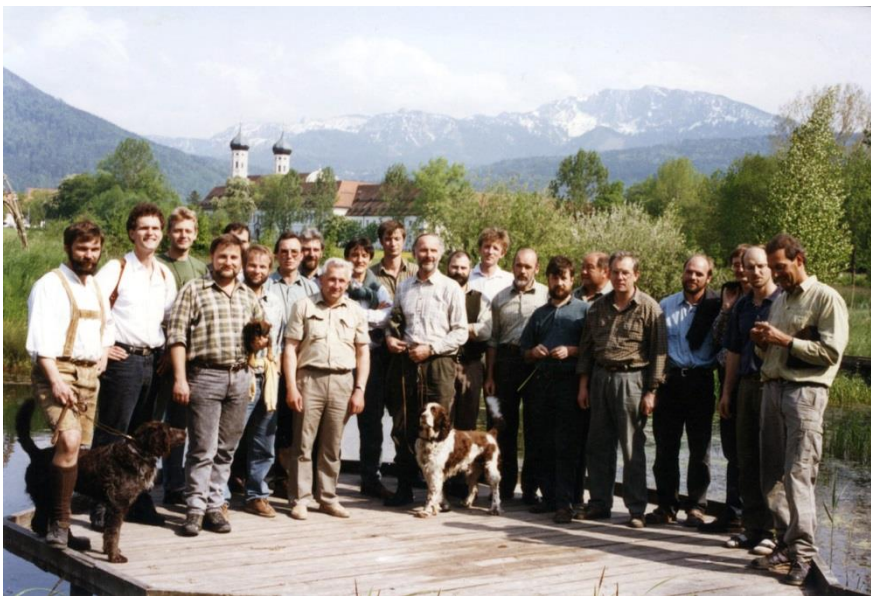
Abbildung 2: Die oberbayerischen Forstlichen Bildungsbeauftragten bei ihrem ersten Fortbildungstreffen im Kloster Benediktbeuern, 1994

Die Oberforstdirektion München beauftragt die geschulten Mitarbeiter zunächst als „Beauftragte für Ordner und Koffer“ und später als „Forstliche Bildungsbeauftragte“ mit der Koordinierung der Waldpädagogik an den Forstämtern. Beginnend in Oberbayern werden bis 2005 bayernweit in jedem Forstamt Bildungsbeauftragte eingesetzt. Bis heute kommen sie jährlich zu einem Austausch- und Fortbildungstreffen zusammen.