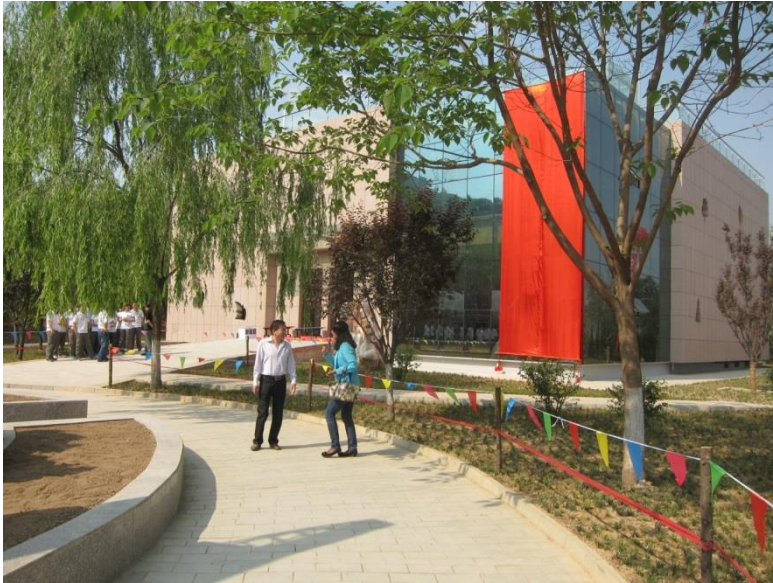
Abbildung 3: 2013 eröffnet das Walderlebniszentrum in Tianshui (Provinz Gansu, China); Quelle: Hubert Forster

Aufgrund konkreter Projektkooperationen hat die bayerische Waldpädagogik auch Auswirkungen auf anderen Kontinenten. So wird die chinesische Provinz Gansu von der Bayerischen Forstverwaltung beim Aufbau des ersten Walderlebnisentrums in China und bei der Ausbildung der dortigen Waldpädagogen unterstützt.