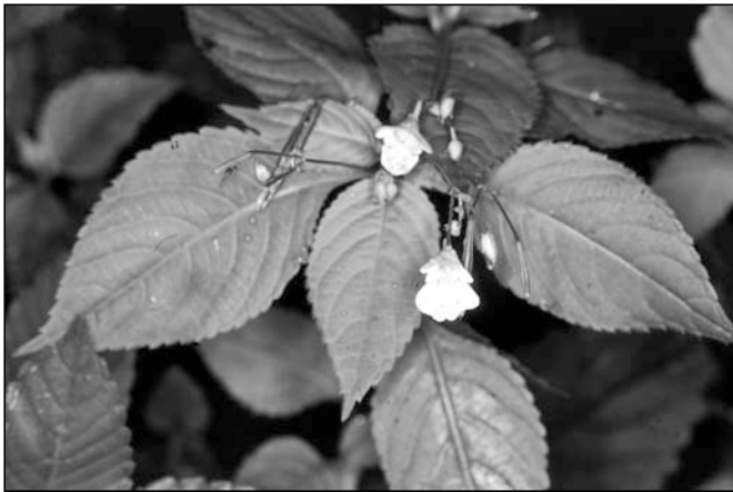
Abb. 2: Das kleinblütige Springkraut hat sich in den heimischen Buchenwaldgesellschaften fest etabliert

Würde es sich dabei nicht um eine eingewanderte, fremdländische Art handeln, könnte sie als Kennart der Ordnung Querco-Fagetalia gewertet werden. Impatiens parviflora besiedelt vor allem Standorte, die für andere Arten aufgrund des Lichtangebots oder der Streuauflage ungeeignet sind. So trifft auch eine Ausbreitung von I. parviflora auf Kosten ihrer heimischen Verwandten Impatiens noli-tangere nicht zu. Das Kleinblütige Springkraut stellt also eher ein Beispiel für eine neue Nutzung bislang ungenutzter ökologischer Nischen dar. Der Effekt auf Blütenbesucher (vor allem Schwebfliegen) und Blattlausfresser kann zudem positiv gewertet werden. Mit dem Kleinblütigen Springkraut wurde die Blattlaus Impatiensium asiaticum gleich miteingeschleppt, die mittlerweile allerdings eine Nahrungsgrundlage für viele heimische Arten bildet.