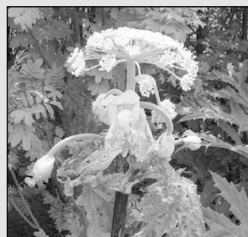
Abb. 1: Die eindrucksvolle Blüte des Riesenbärenklaus ( Heracleum mantegazzianum )

Sebastian Werner, LBV STA, Tel. 0 81 43 – 88 08 oder starnberg@lbv.de