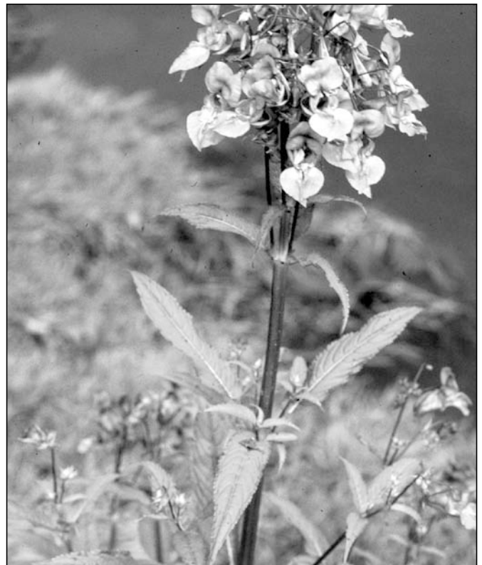
Abb. 1: An heimischen Bachläufen finden sich oft dichte Bestände des indischen Springkrauts Impatiens glandulifera

Das heimische Verbreitungsgebiet von Impatiens glandulifera umfasst den westlichen Himalaya. Die Art wurde ca. 1840 nach England als „Bauern-Orchidee“ eingeführt und als Bienenweide angepflanzt, seit Mitte des 20. Jahrhunderts hat sie sich im gesamten Mittel- bis Westeuropa verbreitet. Auffällig ist die üppige Besiedelung von Bachauen und Grabenrändern, was die Konkurrenzkraft dieser Pflanze an Standorten mit hoher Feuchtigkeits- und Nährstoffversorgung verdeutlicht. Im Wald findet man das Indische Springkraut vorzugsweise in halbschattigen Auenwäldern. Da die einjährige Art erst im Hochsommer eine dominierende Vegetationsschicht aufzubauen vermag, sind die Ausdunkelungseffekte auf andere Arten eher gering und eine Artenverdrängung ist somit unwahrscheinlich.