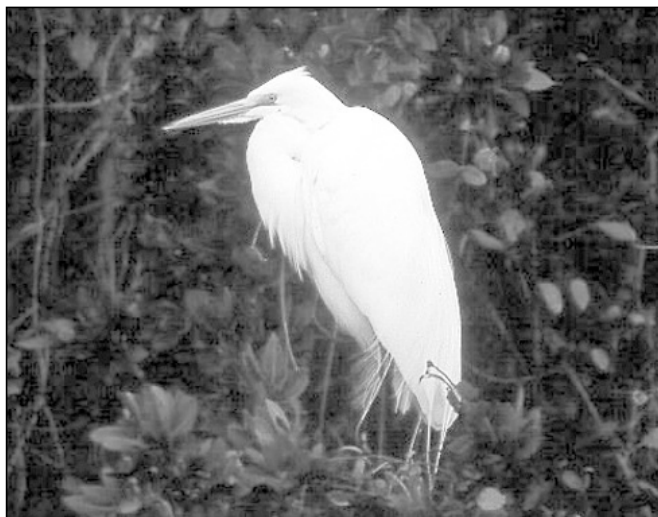
Abb. 1: Der Silberreiher ist erst in neuerer Zeit zu uns eingewandert

che Treiben zu beenden, um den Bestand der endogenen Flora und Fauna, insbesondere den Pflanzenanbau und die Forstwirtschaft nicht zu gefährden. So wurde beispielsweise unser heimischer Star vor etwa 150 Jahren zum Nachteil der Obst- und Weinbauern in Nordamerika, Australien und Neuseeland eingebürgert bzw. eingeschleppt.