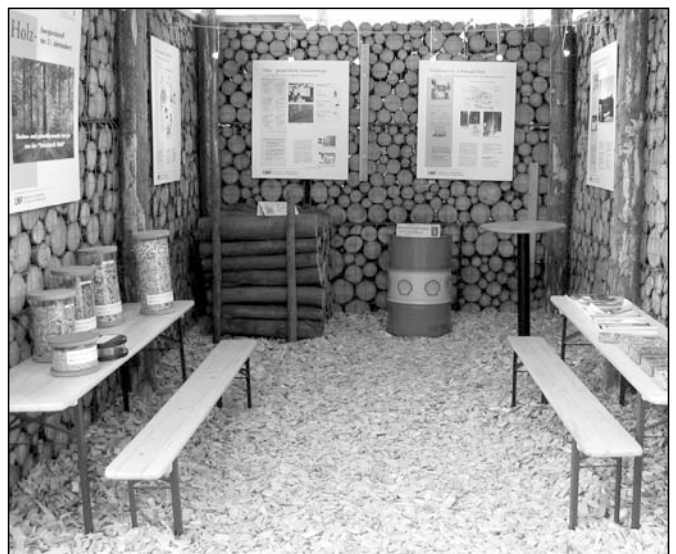
Abb. 1 und 2: Außen- und Innenansicht des Pavillons in Burghausen