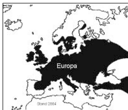
Abb. 1: Verbreitung des Fasans in Europa

Der Fasan gehört zu den Hühnervögeln. Das ursprüngliche Verbreitungsgebiet erstreckt sich über Mittelasien, den südlichen Kaukasus, Nordpersien, die Süd- und Ostmongolei sowie China und die Insel Taiwan. Der Fasan kommt heute in fast ganz Europa vor. Er fehlt jedoch in Portugal und Norwegen sowie in den nördlichen Gebieten in Schweden, Finnland und Russland, im südlichen Europa in Süditalien und Griechenland.