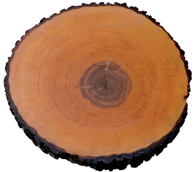
Abbildung 4: Stammscheibe mit kleinem dunkelfarbigem Farbkern

Meist ist Elsbeerholz von ausgesprochen schlichter Textur mit einer nur unauffälligen Zeichnung (Abbildungen 2 und 3). Abweichend davon kann eine Riegelbildung auftreten und es wird dann von „bunter Elsbeere“ gesprochen (Abbildung 5). Nicht selten kommen Markflecken vor, die auf den Längsflächen als längere braune Streifen in Erscheinung treten und mit zunehmender Häufigkeit einen entwertenden Holzfehler darstellen (Abbildung 2). Der Praktiker spricht in diesem Zusammenhang auch von „Haaren“.