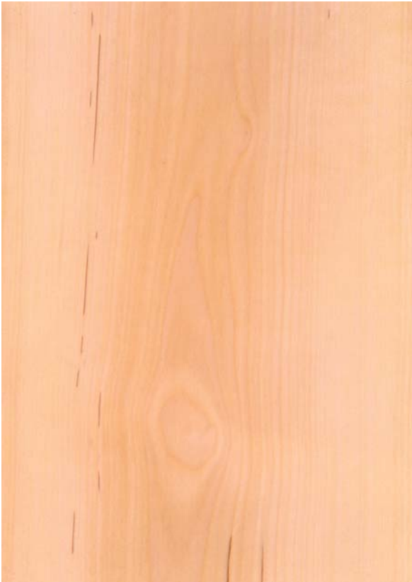
Abbildung 2: Holz (Fladerschnitt) der Elsbeere mit hellem weiß-gelblichem bis schwach rötlichem Farbton; die braunen Linienzüge sind durch Markflecken hervorgerufen.