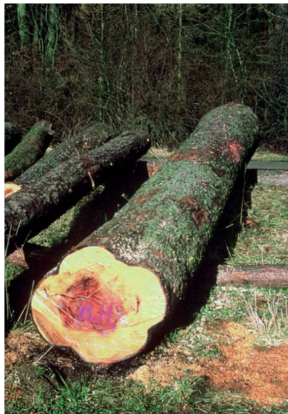
Abbildung 1: Ein Elsbeer-Spitzenstamm aus dem Forstamt Reinhausen bei Göttingen, der 1994 einen Erlös von 14.560 DM/Fm einspielte.

Aber nicht nur forstlich sondern auch holzwirtschaftlich führte die Elsbeere – obgleich im Jahr 1900 auf der Pariser Weltausstellung zum schönsten Holz der Welt ernannt – lange Zeit ein Schattendasein und war selbst Fachleuten bis in die 80er Jahre des letzten Jahrhunderts unbekannt. Deshalb wurde Elsbeer- wie auch Speierlingsholz regelmäßig dem im Aussehen wie auch in den Eigenschaften sehr ähnlichen Birnbaumholz zugeschlagen und unter dem Begriff „Schweizer Birn-