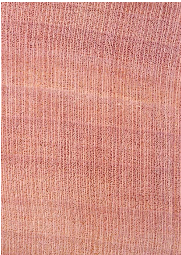
Abbildung 7: Elsbeere, Querschnitt; Lupenbild im Maßstab ~ 10:1

Abgesehen von einer Tendenz zu einer schwachen Halbringporigkeit mit zunehmender Jahrringbreite sind die zahlreichen und einzeln stehenden Gefäße zumeist typisch zerstreutporig angeordnet. Die Gefäße sind ausgesprochen fein und somit erst unter der Lupe erkennbar (Abbildungen 6 und 7). Der Feinporigkeit entsprechend sind die Längsflächen kaum nadelrissig. Die Holzstrahlen sind ebenfalls mit bloßem Auge kaum wahrnehmbar und lediglich auf sauber abgezogenen Hirnflächen als dicht gestellte, feine Linienzüge deutlich (Abbildung 7). Etwas prägnanter, ohne aber besonders auffällig zu werden, treten die Jahrringe infolge eines etwas dichteren letzten Spätholzes hervor. Auf den Tangentialflächen ergibt sich dadurch die zuvor bereits herausgestellte unauffällige feine Fladerzeichnung, die zusammen mit dem warmen Rotton dem Elsbeerholz sein edles Aussehen verleiht (Abbildungen 3 und 5). Gehobelte Flächen sind fast glanzlos. Ein besonderer Geruch fehlt.