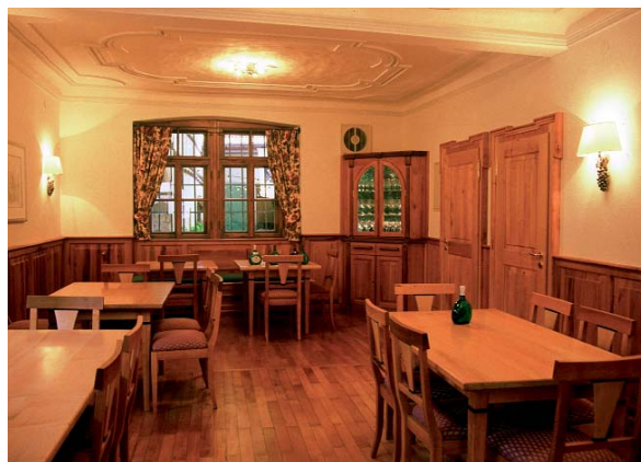
Abbildung 10: Weinprobierstube in Iphofen als Beispiel der Verwendung der Elsbeere in massiver Form