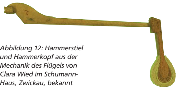
Abbildung 12: Hammerstiel und Hammerkopf aus der Mechanik des Flügels von Clara Wied im Schumann-Haus, Zwickau, bekannt durch seine Darstellung auf der früheren 100 DM-Banknote. Für den Stiel wurde Elsbeere, für den Kopf Echtes Mahagoni ( Swietenia spec. ) verwendet (Holzartenbestimmung: D. Grosser)

Neben Birnbaum gehört Elsbeere wegen ihrer hervorragenden Formbeständigkeit (s. o) seit jeher zu einem gesuchten Spezialholz für die Herstellung von Linealen, Stockmetern und anderen Messwerkzeugen sowie von Zeichengeräten. Früher wurden ferner Zollstöcke außer aus Hainbuche gerne aus Elsbeere hergestellt. Auch wissenschaftliche Instrumente, Stethoskope und Rechenschieber wurden bevorzugt aus Elsbeere und Birnbaum gefertigt, solange Holz in diesen Bereichen verwendet wurde. In Frankreich ist sie bis heute gesucht für die Herstellung von Stielen einschließlich wertvoller Billardstöcke. Ferner lassen sich aus Elsbeere hochwertige Gussmodelle und Bleistifte herstellen. Besonders geschätzt ist die Elsbeere wegen ihrer ansprechenden Farbe und ihrer problemlosen Bearbeitbarkeit als Drechsel- und Schnitzholz und kann gleich Buchsbaum zu den feinsten Arbeiten verwendet werden.