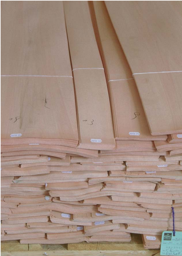
Abbildung 8: Hochwertige Messerfurniere für den anspruchsvollen Innenausbau und luxuriösen Möbelbau

Elsbeerholz lässt sich allgemein ohne größere Probleme bearbeiten, bedarf aber wegen seiner Härte eines höheren Kraftaufwandes. Mit sorgfältig geschärften Werkzeugen lässt sich Elsbeere problemlos sägen sowie gut und sauber hobeln, profilieren, dreheln und schnitzen. Desgleichen ist es gedämpft hervorragend messerbar. Holzverbindungen mit Nägeln und Schrauben sind leicht zu bewerkstelligen und halten gut. Das Verkleben ist dagegen wegen der sehr dichten Oberflächenbeschaffenheit des Holzes erschwert.