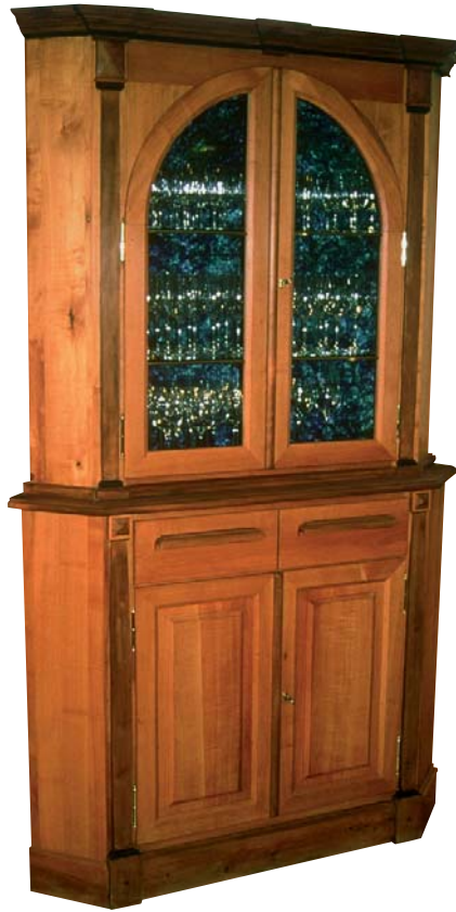
Abbildung 11: Einbauschränk aus Massivholz; Weinprobierstube in Iphoven

Im Innenausbau gehört Elsbeerholz zu den bevorzugten Edelhölzern für repräsentative Kundenräume von Banken und Sparkassen, Konferenz- und Geschäftsräume von Handels- und Industriekonzernen wie auch von Ladengeschäften und Restaurants mit gehobenem Anspruch. Hier sind speziell für Wand- und Deckenbekleidungen sowie für großflächige Einbauten warmrote Furniere mit zarter Zeichnung gefragt. Aufgrund ihrer hohen Härte eignet sich Elsbeere auch sehr gut für Fertiparkettböden.