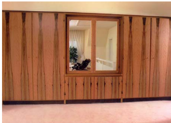
Abbildung 9: Eingauschrank; die Mitverwendung des schwarzbraunen Kernholzes verleiht dem Möbel Individualität und Exklusivität.

Verwendet wird Elsbeerholz vornehmlich als Ausstattungsholz sowohl in Form von hochwertigen Messerfurnieren (Abbildung 8) als auch in Form von Massivholz. Im Möbelbau dient es bevorzugt zur Herstellung exklusiver Möbel mit hohem Anspruch an Qualität und Design. Ebenso ist Elsbeere gesucht für die handwerkliche Anfertigung individueller Einzelmöbel und wird dafür gerne auch unter Mitverwendung des Falschkerns verarbeitet, wodurch dem Möbelstück seine Einmaligkeit gegeben wird (Abbildungen 9 bis 11).