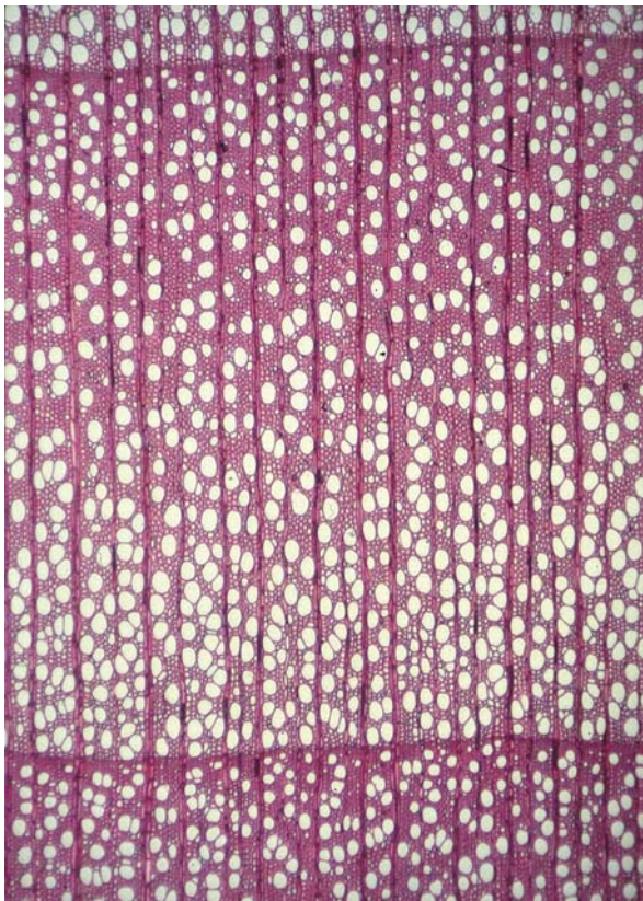
Abbildung 6: Elsbeere, Querschnitt; Mikrobild im Maßstab ~ 25:1