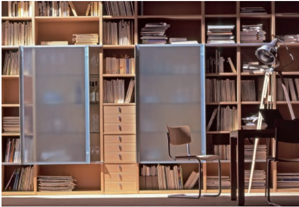
Abbildung 6: Regalsystem aus Ahorn in Kombination mit Glas. Modell Interlücke (Foto: Interlücke; aus Grosser und Teetz 1998)