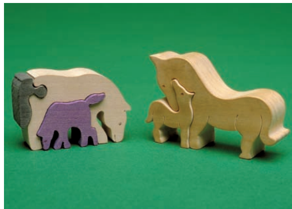
Abbildung 12: Bergahorn eine gern und vielfach für Spielwaren eingesetzte Holzart

üblicherweise aus Kunststoffen hergestellt werden, so waren sie in früheren Zeiten häufig aus Ahorn gefertigt.