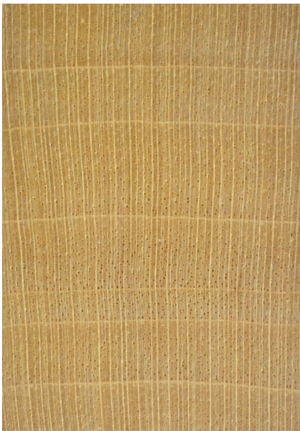
Abbildung 2: Bergahorn Querschnitt; Lupenbild im Maßstab 6 : 1

gewebe mit kleineren Gefäßen, zum anderen durch ein auffälliges hellfarbiges letztes Spätholzband (Abb.2). Die Gefäße finden sich in zerstreutporiger Anordnung. Mit tangentialen Durchmessern unter 100 µm sind sie recht fein und auf der Hirnfläche erst unter der Lupe besser erkennbar. Dementsprechend treten sie auch auf den Längsflächen kaum und nur auf sehr sauber gehobelten, ungeschliffenen Längsflächen in Erscheinung. In ihrer Anzahl weniger häufig sind die Gefäße einzeln bis zu kurzen radialen Gruppen angeordnet (Abb.2). Die Holzstrahlen sind ziemlich breit und relativ enggestellt, dabei auffallend gerade, helle Linienzüge bildend. Mit den ebenso hellen Jahringgrenzlinien formen sie als besonders charakteristisches Merkmal für die Ahornarten saubere, radial ausgerichtete Rechtecke (Abb.2). Auf den Radialflächen erscheinen die Holzstrahlen als zahlreiche rötlich bis rötlichbraun gefärbte, glänzende Spiegel, die das Holzbild in besonderer Weise beeinflussen. Im Übrigen sind die Längsflächen fein gefladert (Tangentialschnitt, Abb.1) bzw. fein gestreift (Radialschnitt). Gehobelt zeigt das Holz einen schönen seidenartigen Glanz. Ein spezieller Geruch fehlt.