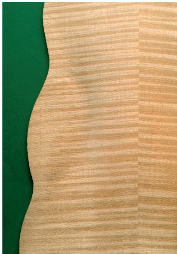
Abbildung 3: Holz des Bergahorn mit Riegelwuchs; Ausschnitt aus einem Geigenboden-Rohling