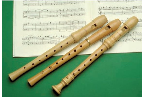
Abbildung 10: Bergahorn stellt neben Birnbaum die Hauptholzart für die Fertigung von Blockflöten dar

Beste Eignung besitzt Ahorn für Drechsler-, Schnitz- und Bildhauerarbeiten. Hier erstreckt sich die Produktpalette von Möbelteilen, wie z. B. Stuhlbeinen und Tischbeinen über Haus- und Küchengeräte (z. B. Frühstücks- und Schneidbretter, Löffel, Fleischklopfer, Quirle oder Nudelhölzer, Abb.11), Kunstgewerbeartikel bis zu Billardstöcken, Figuren und Holzplastiken. Als weitere Verwendungsbereiche lassen sich Sportgeräte, Spielwaren (Abb.12), Spielbretter einschließlich der weißen Felder von Schachbrettern nebst Spielfiguren, Kleiderbügel und Schuhspanner nennen, wie überhaupt die Holzwarenindustrie bei der Herstellung von Artikeln mit naturbelassenem Holz gerne auf das ansprechend hellfarbige und hygienische Ahornholz zurückgreift. Auch wenn heutzutage Mess- und Zeichengeräte oder die Leisten der Schuhmacher