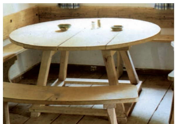
Abbildung 9: Der zünftige Wirtshaustisch besitzt immer eine massive Platte aus A-hornholz, das infolge Feinporigkeit leicht gepflegt werden kann und zugleich die notwendige Härte und Abriebfestigkeit aufweist

Bergahorn ist in erster Linie ein gesuchtes Holz für den hochwertigen Möbel- und Innenausbau, dabei vornehmlich als Furnier sowohl mit schlichter als auch geriegelter Textur eingesetzt. Außerdem gehört es zu den wichtigsten Hölzern im Musikinstrumentenbau.