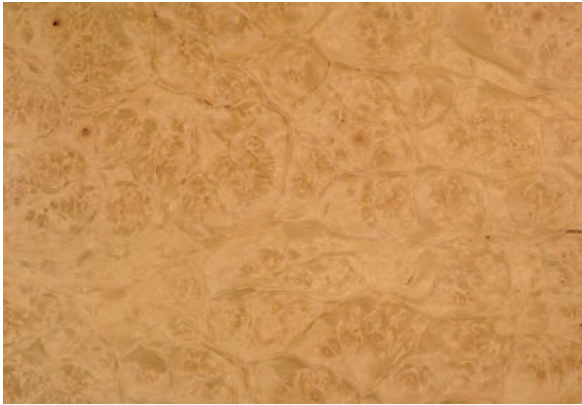
Abbildung 4: Holz des Bergahorns mit wertvollem Maserwuchs