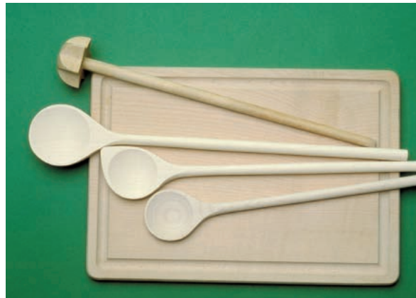
Abbildung 11: Das hellfarbige Holz des Bergahorns findet vielfältig für Haus- und Küchengeräte Verwendung wie für Schneidbretter, Löffel und Quirle