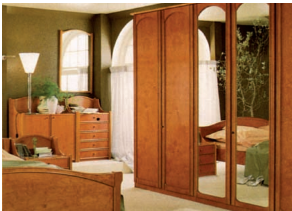
Abbildung 7: Mit Ahorn furnierte Schlafzimmerelemente, kirschbaumfarbig gebeizt (Foto: Loddenkemper, Vogelsanger Studios, Oelde; aus Grosser und Teetz 1998)

Als Möbelholz wird Bergahorn insbesondere für Fronten und Türen von Schränken im Schlafzimmer- und Wohnzimmerbereich sowie für Kleinmöbel verwendet. Wegen des Vergilbens bleibt das Holz allerdings seltener naturbelassen (Abb.6). Vielmehr werden die Oberflächen bevorzugt pastellfarben eingefärbt (Abb.7). Naturbelassen dienen die Furnieren vornehmlich der Innenauskleidung hochwertiger Möbel. Massiv kommt Ahorn insbesondere für die Einrichtung von Küchen zum Einsatz (Abb.8). Eine aus Ahorn-Vollholz hergestellte Tischplatte gehört zu jedem zünftigen Wirtshaustisch (Abb.9). Gerne wird sein helles Holz auch in Kontrast zu dunkleren Hölzern eingesetzt, wie z.B. als Zierleisten oder eingelassene Adern. Ebenso wird es vom Kunsttischler gerne für Einlegearbeiten (Intarsien) ausgewählt.