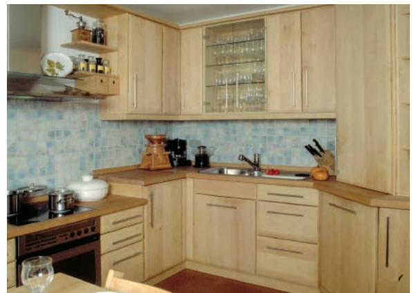
Abbildung 8: Kücheneinrichtung in handwerklicher Fertigung aus Bergahorn-Massivholz (Foto: B. Zimmer; aus Grosser und Teetz 1998)

Als Möbelholz wird Bergahorn insbesondere für Fronten und Türen von Schränken im Schlafzimmer- und Wohnzimmerbereich sowie für Kleinmöbel verwendet. Wegen des Vergilbens bleibt das Holz allerdings seltener naturbelassen (Abb.6). Vielmehr werden die Oberflächen bevorzugt pastellfarben eingefärbt (Abb.7). Naturbelassen dienen die Furnieren vornehmlich der Innenauskleidung hochwertiger Möbel. Massiv kommt Ahorn insbesondere für die Einrichtung von Küchen zum Einsatz (Abb.8). Eine aus Ahorn-Vollholz hergestellte Tischplatte gehört zu jedem zünftigen Wirtshaustisch (Abb.9). Gerne wird sein helles Holz auch in Kontrast zu dunkleren Hölzern eingesetzt, wie z.B. als Zierleisten oder eingelassene Adern. Ebenso wird es vom Kunsttischler gerne für Einlegearbeiten (Intarsien) ausgewählt.