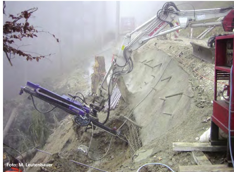
Abbildung 3: Bohren der Ankerrohre mit Baggerlafette

Zurück in die Gemeinde Wackersberg zu einer besonderen Situation: An einer Stelle eines Forstweges im Flysch war im Frühjahr 2011 zu beobachten, dass die Fahrbahnoberfläche des Weges auf einer Länge von etwa 10 m wellig geworden war. Die Hangneigung in diesem Bereich beträgt circa 75 %. Die erste Vermutung war, dass der talseitige Auftrag bei der Steilheit des Geländes zu wenig Verzahnung mit dem gewachsenen Boden aufweist und gerade bei niederschlagsreichen Witterungsverhältnissen der Schwerkraft folgend talwärts wandert. Als sich nach wenigen Wochen dann ein Riss von 35 m Länge in der Deckschicht gebildet hatte, wurde – wie schon oben beschrieben – der Wegekörper bis zum vermeintlich stabilen gewachsenen Untergrund ausgekoffert und im System »Bewehrte Erde« mit einem Böschungswinkel von 60° wieder aufgebaut.