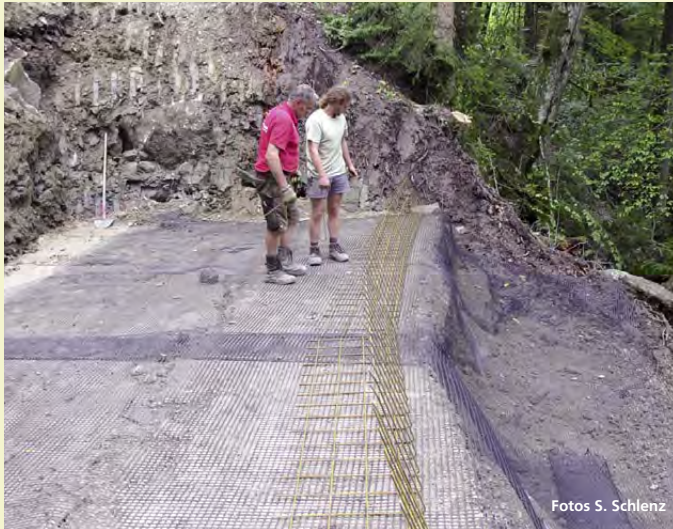
Abbildung 2: Bewehrte Erde mit verlorener Schalung; links: Vorbereiten der verlorenen Schalungselemente; rechts: Fertige Ansicht mit sechs Lagen

Mit diesem System, bei dem zur Bewehrung und Rückverankerung ein flexibles und dehnungsarmes Geogitter zum Einsatz kommt, können Böschungswinkel von 60^\circ hergestellt werden. Bei zusätzlicher Verwendung vorgefertigter Baustahlmatten als verlorener, also nicht mehr ausgebaute Schalung sind sogar Böschungswinkel bis zu 80^\circ möglich. Nachdem im Falle unseres beschädigten Forstweges eine 60^\circ -Böschung ausreichend war, wurde die kostengünstigere Variante ohne den Einbau der Baustahlmatten gewählt.