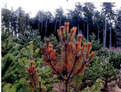
Nadelbräuneschäden auf der Versuchsfläche Geibenstetten

dend beeinflusst. Der Herkunftsüberprüfung von Alternativbaumarten, die wegen des Klimawandels zusätzlich eingebracht werden sollen, kommt daher eine besondere Bedeutung zu. Ein unkontrollierter Anbau neuer Baumarten birgt ein hohes Risiko, insbesondere wenn ungeeignete Provenienzen verwendet werden. Das ASP wird daher in den nächsten Jahren einen Schwerpunkt auf Anbau- und Herkunftsversuche neuer Baumarten legen. Randolf Schirmer