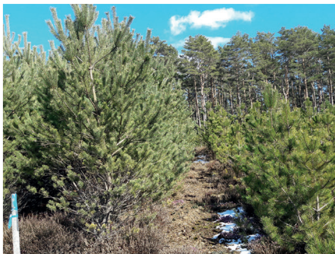
Höhenunterschiede zwischen zwei Schwarzkieferprovenienzen im Alter 8 auf der Versuchsfläche Vilseck

Die auf allen Flächen bisher überragenden Herkünfte kommen aus Zentralfrankreich. Auch je eine Herkunft aus Süditalien und Nordgriechenland zeigen überdurchschnittliche Wuchsleistungen. Die Unterart P. nigra subsp. laricio übertrifft zumindest in der Jugendphase die Unterart P. nigra subsp. nigra deutlich. Dagegen kann vor allem die Unterart P. nigra subsp. pallasiana aus der Südosttürkei auf keinem Versuchsstandort überzeugen.