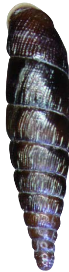
Abbildung 1: Die stark gefährdete Nördliche Kastanienbraune Schließmundschnecke ( Macrogastrea badia crispulata ) wurde bisher ausschließlich in Naturwaldreservaten und naturnahen Wäldern des Bayerischen Waldes und der Berchtesgadener und Allgäuer Alpen nachgewiesen. Sie lebt hier meist hinter der abgeplatzten Rinde von Totholzstücken auf feuchten Standorten.

Im Vergleich zu Gewässern und Offenlandbiotopen weisen naturnahe Wälder bisher nur einen äußerst geringen Anteil fremdländischer Molluskenarten auf. Für die bayerischen Naturwaldreservate sind derzeit nur die Spanische Wegschnecke und die Kantige Laubschnecke ( Hygromia cinctella ) bekannt.