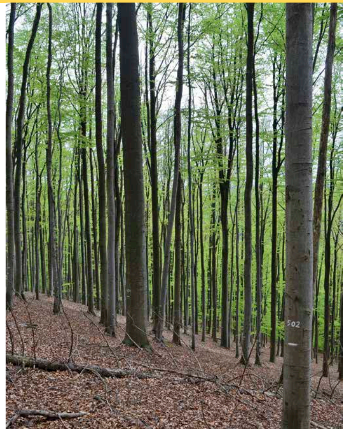
1 Repräsentationsfläche des NWR Hammerleite im Frankenwald

Die Repräsentationsflächen wurden in den meisten Fällen Ende der 1970er Jahre angelegt, wobei überwiegend reifere Bestandteile der Naturwaldreservate Berücksichtigung fanden. Seitdem haben sich in vielen Fällen hohe Holzvorräte im lebenden Bestand angesammelt und die Mengen an stehendem und liegendem Totholz sind angestiegen.