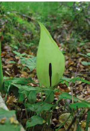
2 Aronstab, eine Pflanze der nährstoffreicheren Laubwälder

2012 wurde die Dauerbeobachtung in den bayrischen Naturwaldreservaten (NWR) auf 26 Schwerpunktreservate konzentriert und somit auf »neue Füße« gestellt. Das Ziel dahinter: Waldkundliches und waldökologisches Monitoring miteinander verknüpfen, um das Wissen über Zusammenhänge zwischen Waldstrukturen und Artengemeinschaften zu vertiefen. Erste Ergebnisse aus diesen Untersuchungen liegen nun vor.