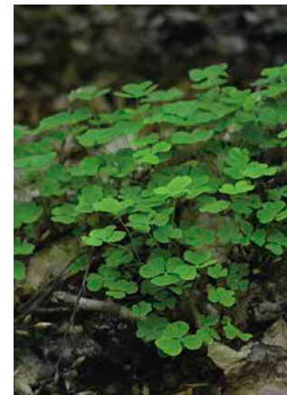
6 Der Sauerklee ist eine der häufigsten Pflanzen in den NWR.

Das Literaturverzeichnis finden Sie unter www.lwf.bayern.de in der Rubrik »Publikationen«.