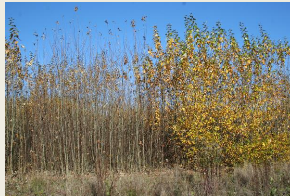
Austriebsunterschiede im 2-jährigen Energiewald