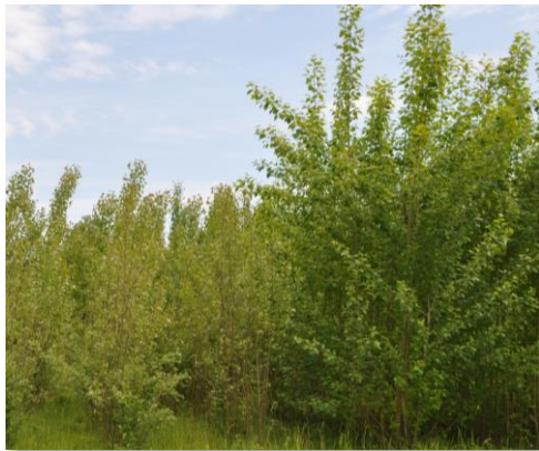
Unterschiedliche Wuchsleistung von Pappelsorten auf einem Sortenprüffeld des ASP

Der Vertrieb der Sorten ist nach dem Forstvermehrungsgesetz nur durch angemeldete Forstbauschulen zulässig.