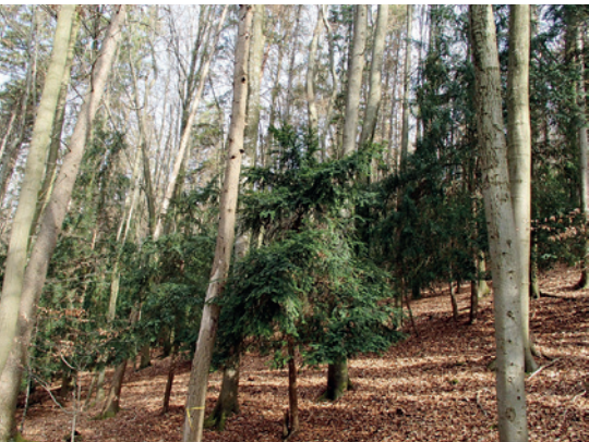
Ein seltenes Bild: Der Unterstand wird dominiert von der Eibe, Vorkommen bei Weismain in Oberfranken.

Im Zuge der sich ändernden Umweltbedingungen und im Jahr der Biodiversität gewinnt das Projekt »Erarbeitung von Herkunftsempfehlungen und Verbesserung der Erntebasis für die vier seltenen Baumarten Feldahorn, Flatterulme, Speierling und Eibe in Bayern auf genetischer Grundlage« eine ganz besondere Bedeutung. Für den Umbau abgängiger Bestände brauchen wir unter anderem geeignete Herkünfte heimischer seltener Baumarten. Das vom bayerischen Kuratorium finanzierte Projekt soll Grundlagen schaffen, um die Versorgung mit qualitativ hochwertigem Saat- und Pflanzgut sicherzustellen und damit Alternativen für den Waldumbau anbieten zu können.