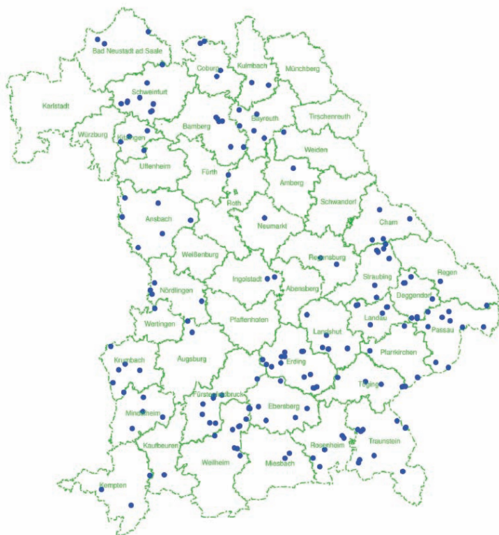
Abb. 4: Aktuelle Verbreitung des Eschentriebsterbens

Für die rege Beteiligung bei den Umfragen und der Probeeinsendungen bedanken wir uns bei allen teilnehmenden Waldbesitzern und Revierleiter/innen. Wir bitten bei jeder Einsendung unser Formular zur Probensendung (download unter: www.eschentriebsterben.org ) auszufüllen. Es erleichtert uns die Beantwortung und Beurteilung des Sachverhaltes.