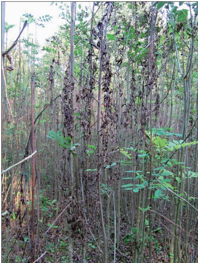
Abb. 1: Typische Krankheitsmerkmale an jungen Eschen nach Befall mit dem Eschentriebsterben

Seit dem Herbst 2008 ist in weiten Teilen Bayerns an der Esche ( Fraxinus excelsior ) eine neue Erkrankung, das Eschentriebsterben Chalara fraxinea , auffällig geworden. Im Laufe des Jahres 2009 wurden deshalb durch die LWF verschiedenste Untersuchungen durchgeführt. Zusammenfassend in Kürze das Wichtigste.