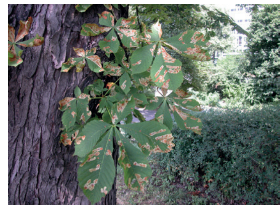
3 In nur wenigen Jahren hat sich die Rosskastanienminiermotte in ganz Bayern ausgebreitet. Ihre Schäden sind zwar sehr auffällig, jedoch ohne wirklich schwerwiegende Folgen für die befallenen Bäume.

Ein Paradebeispiel für einen rasanten Eroberungszug durch Mitteleuropa ist die Rosskastanienminiermotte ( Cameraria ohridella ) (Abbildung 3). 1989 wurde sie erstmals in Österreich bei Linz nachgewiesen. Seither hat sie sich über das Donautal nach Bayern in die Täler von Inn und Isar vor allem in den Jahren 1992 bis 1995 rasant ausgebreitet (Schmidt 1997). Über Tschechien fand die Art Anschluss an die Elbe (Skuhravy 1998) und