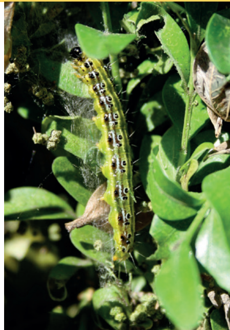
4 Eine regelmäßige Kontrolle der Buchspflanzen und das Absammeln vorhandener Raupen ist eine erfolgversprechende und die Umwelt schonende Bekämpfungsmaßnahme gegen den Buchsbaumzünsler.

In bayerischen Wäldern haben sich auch zwei eingeschleppte Borkenkäferarten etabliert. Der Schwarze Nutzholzborkenkäfer ( Xylosandrus germanus ) und der Amerikanische Nutzholzborkenkäfer ( Gnathotrichus materiarius ). Der Schwarze Nutzholzborkenkäfer stammt aus Ostasien und konnte 1952 erstmals in Deutschland im Raum Darmstadt nachgewiesen werden. Inzwischen hat sich diese Art in Deutschland weit ausgebreitet. Die holzbrütende Borkenkäferart züchtet, ebenso wie der heimische Gestreifte Nutzholzborkenkäfer, Ambrosiapilze in ihren Brutgängen. Sie befällt als Sekundärschädling Nadel- und Laubholz. Ein gutes Merkmal sind die bei frischem Befall wie kleine weiße Stacheln von der Stammoberfläche abstehenden weißen »Bohrmehlwürstchen« (Schilling 2007).