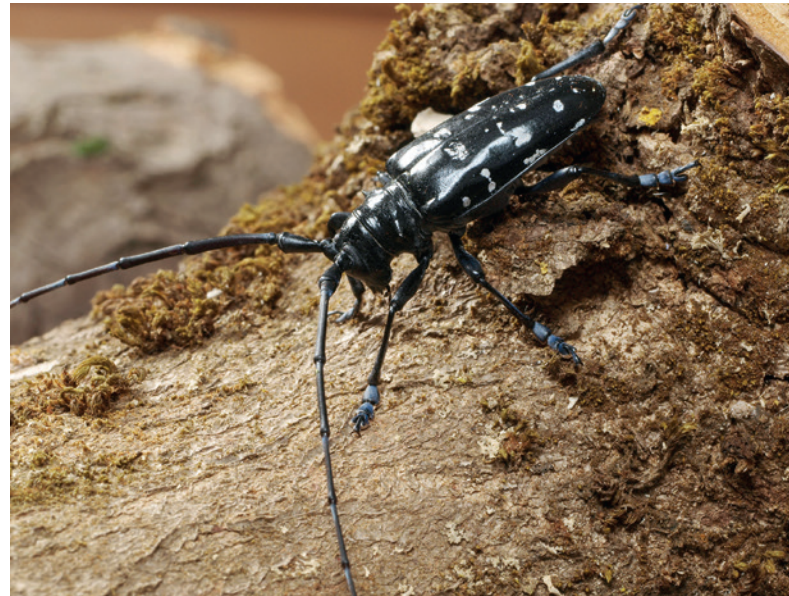
1 Der Asiatische Laubholzbockkäfer wird als neozoisches Insekt in der Forstwirtschaft zurecht sehr kritisch beurteilt.

Die Globalisierung macht's möglich. Kreuz und quer werden Tiere, Pflanzen und Pilze durch den weltweiten Handel aus ihren angestammten Regionen verschleppt und finden woanders neue Heimaten, wo sie sich meist unauffällig einfügen. Werden die »Neubürger« entdeckt, dann heißt es für die verantwortlichen Behörden und Pflanzenschutzdienste: genaue Artdiagnose, umfassende Risikobewertung und ausführliche Einzelfallbeurteilung – ganz ohne Dogmatik und Panikmache.