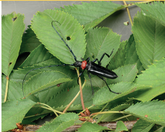
7 In Südbayern wurden mehrere Asiatische Moschusbockkäfer gefunden. Dies ist der erste amtlich bestätigte Befall in Deutschland. Typisch ist der rote Halschild.

Auch der Asiatische Moschusbockkäfer ( Aromia bungii , Abbildung 7) ist bisher in Deutschland noch nicht etabliert. Allerdings wurden 2011 und aktuell 2016 erwachsene Käfer in Kolbermoor und Rosenheim (Oberbayern) aufgefunden. Aromia bungii ähnelt dem heimischen Moschusbock ( Aromia moschata ), befällt aber vor allem Prunus -Arten (s.a.