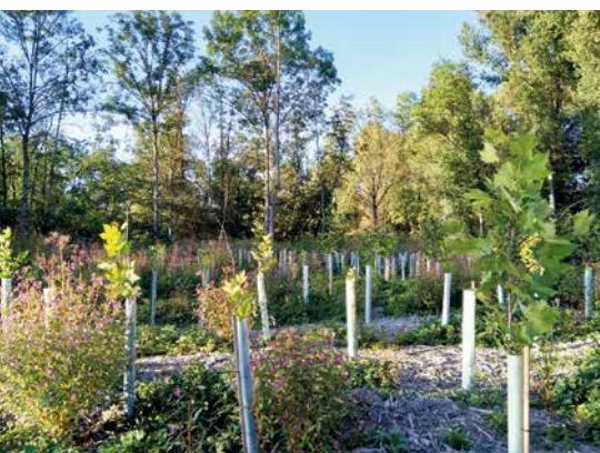
1 Freiflächen-Parzelle mit Ahornblättrigen Platanen in Tubex-Wuchshüllen in der ersten Vegetationsperiode.

Jeder der vier beteiligten Forstbetriebe wählte sowohl einen Ausgangsbestand in einem Hybridpappel- als auch einem Edellaubholzbestand (soweit möglich mit führender Esche) aus. Diese Bestandestypen entsprechen den beiden Problemstellungen eines sich durch das Eschentriebsterben auflösenden Eschenbestandes sowie eines naturfernen Hybridpappelbestandes. Da jede der Versuchsflächen sowohl über eine Schirm- als auch eine Freifläche