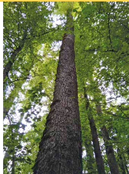
3 Einzelne überlebende Feldulmen im Forstbetrieb Kaisheim zeigen, welche Dimension und Qualität diese Baumart erreichen kann, und geben Hoffnung auf eine möglicherweise resistente Linie. Die Bäume werden regelmäßig zur Anzucht von Jungpflanzen beerntet, welche im Forstbetrieb wieder ausgebracht werden. Eines der Beispiele, die bei der Best-Practice-Recherche gesammelt wurden.

Darum sind neben den umfangreichen Versuchsanbauten auch die Erfahrungen der Auenwaldförster vor Ort ein wichtiger Teil des Projekts »Auenwald im Klimawandel«. Die Förster waren bei der Auenwaldbewirtschaftung gezwungenermaßen immer kreativ und entwickelten Lösungsansätze, die sich in der Praxis bewähren konnten, aber teilweise keinen Niederschlag in forstliche Literatur fanden. Hinzu kommt, dass die Forstreviere mit Auenwald nur einen geringen Anteil aller Reviere ausmachen, aber weit zerstreut sind. Ein Austausch von Wissen und Erfahrungen findet daher nicht in dem Umfang statt, wie es in der Forstwirtschaft im Landwald der Fall ist. Darum werden im Zuge des Projekts Wissen und erfolgreiche Konzepte zur Auenwaldbewirtschaftung, sogenannte »Best-Practice-Beispiele«, zu welchen bisher wenig umfassende Veröffentlichungen vorliegen, dokumentiert und bewertet (vgl. Abbildung 3). Dieses Praxiswissen fließt zusammen mit den Beobachtungen der Versuchsflächen in einen Leitfaden zur Auenwaldbewirtschaftung ein. Durch den Leitfaden soll ein Wissens- und Methodentransfer in die waldbauliche Praxis für Forstbetriebe und Waldbesitzer sichergestellt werden.