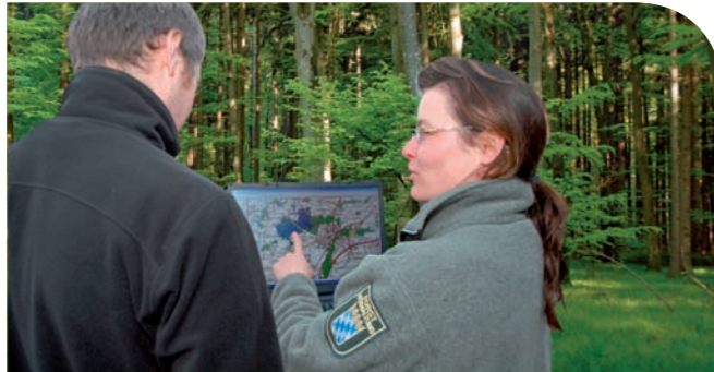
■ Wir entwickeln Klima-Risikokarten für den Wald von Morgen und schaffen eine wichtige Grundlage für eine zukunftsorientierte forstliche Beratung.