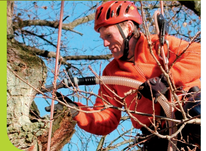
■ Um wichtige Tierarten für Natura 2000 zu erfassen, entwickeln wir neue Methoden. Mit dem Mulmsauger können seltene Käfer in Baumhöhlen nachgewiesen werden.

Wir bestimmen tierische, pflanzliche und pilzliche Schädlinge an Waldgehölzen, überwachen deren Entwicklung, beraten und leisten organisatorische Unterstützung bei unumgänglichen Bekämpfungsmaßnahmen. Ein ständig aktueller Informationsdienst gehört zu unseren gefragten Angeboten.