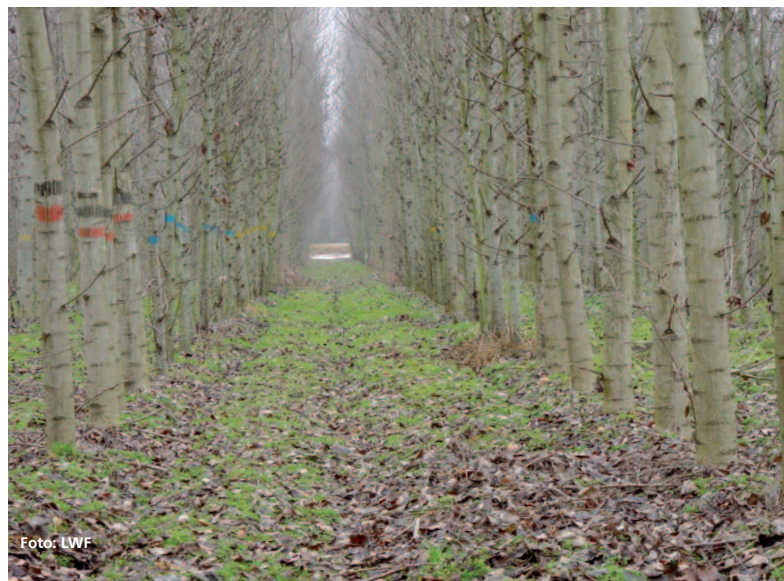
Abbildung 3: Die Hackschnitzelmenge eines Hektars einer Kurzumtriebsplantage kann jährlich bis zu 6.000 Liter Heizöl ersetzen. Trotz der vielen Vorteile will aber der Anbau der KUPs in Bayern nicht so recht vorankommen.