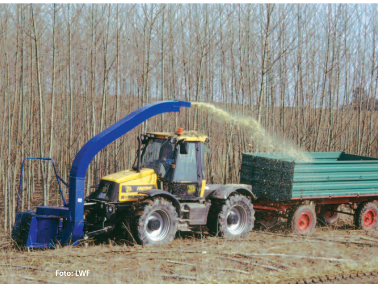
Abbildung 2: Mit leistungsfähigen Pappelklonen können im fünfjährigen Umtrieb bis zu 35 Tonnen erntefrische Hackschnitzel pro Jahr und Hektar geerntet werden.