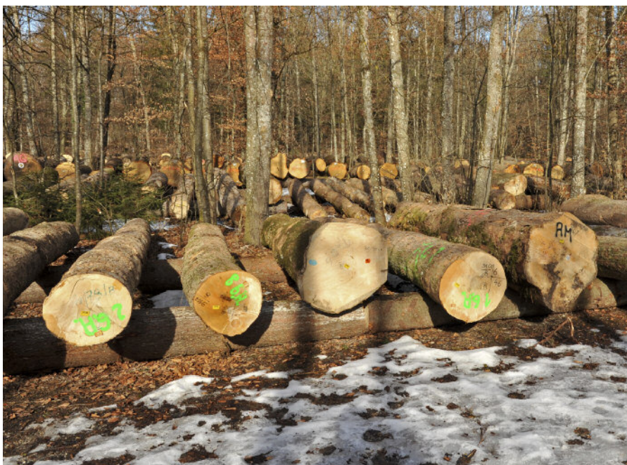
Abbildung 5: Submissionsplatz

Die beste Prophylaxe besteht darin, das Holz vor Beginn der Schwärmzeit, also bis Anfang März, abzuführen. Entrindung schützt nur dann vor Befall, wenn die Stämme sehr rasch austrocknen können. Die Lagerung von Nadelholz in Laubholzbeständen oder außerhalb des Waldes verhindert die Besiedelung mit Nutzholzborkenkäfern weitgehend. Die Einrichtung ständiger Lagerplätze an diesen Standorten wird nicht empfohlen, weil die Käfer im Boden überwintern und von dort ausgehend wieder Schäden verursachen können (Schneider 1998).