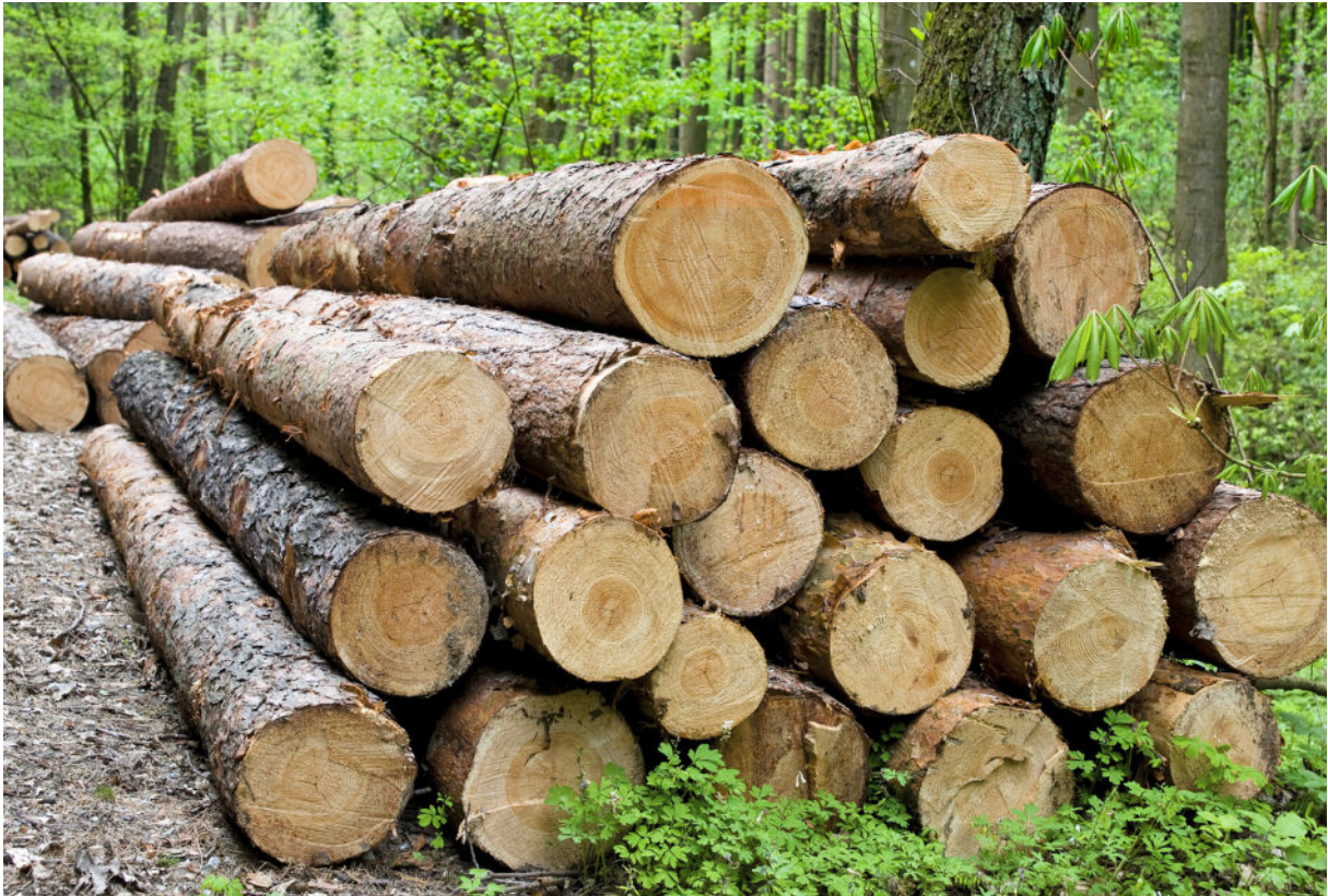
Abbildung 4: Poltern in Rinde

von Pilzen befallen. Es ist deshalb von Vorteil, das Holz möglichst lang und mit großzügigen Überlängen auszuhalten. Dadurch wird der Stirnflächeneffekt minimiert und man kann die Stämme mit nur geringen Wertminderungen gesundschneiden. Die niedrigen Lagerkosten gleichen diese Verluste teilweise aus. Werden Fixlängen ausgehalten, sind Überlängen in der Regel nicht möglich, da die Abnehmer der Fixlängen, namentlich Großsägerwerke, oft keine Kappanlagen haben.