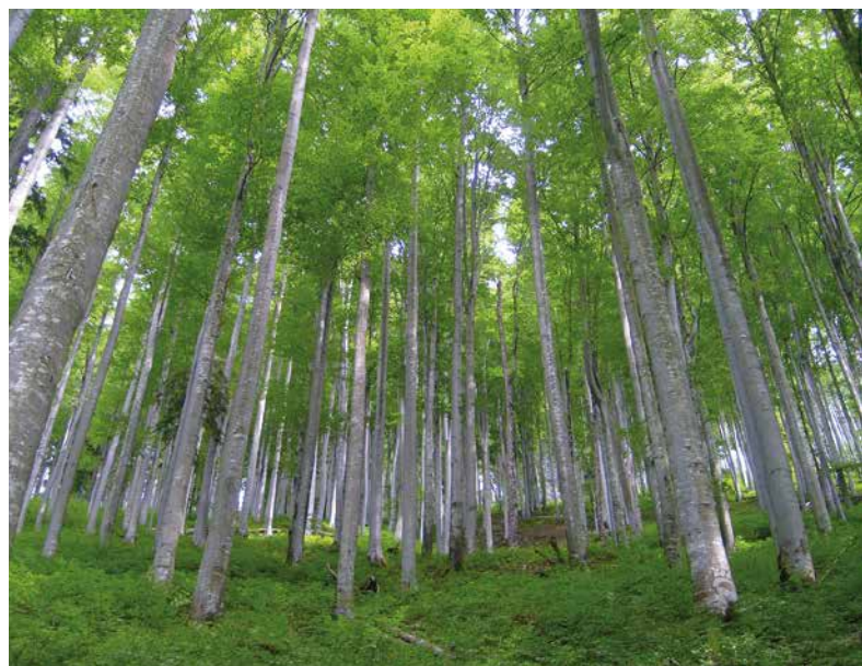
Bayerischer Rotbuchen-Erntebestand

Traditionell stehen bei Herkunftsfeldversuchen Anwuchs, Wachstum und Qualität bewährter Herkünfte im Zentrum der Aufmerksamkeit, da schließlich adäquate Vorschläge für die Forstpraxis gegeben werden sollten. Der Fokus vieler älterer Herkunftsversuche war auf die Ertragsleistung ausgerichtet. Die Anpassungsfähig-