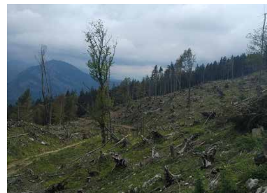
Felshumusböden sind besonders gefährdet durch Humusschwund und Nährstoffverlusten, wenn sie großflächig freigelegt werden.