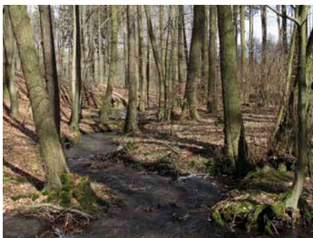
3 Kühl, nährstoffarm und langsam fließend – das ideale Gewässer für die Larven.

Im folgenden Jahr sucht das Weibchen, meist im März, die Uferbereiche klarer Waldbäche auf, um dort über mehrere Nächte verteilt zwischen zehn und 70 Larven abzusetzen. Zwischen Juni und September gehen die frisch umgewandelten, etwa 5 cm langen, Jungsalamander an Land. Der Feuersalamander laicht nicht in Stillgewässern wie unsere Molche, sondern ganz überwiegend in fließgewässern. Es sind vor allem die fischfreien Bachoberläufe, die er benötigt, damit sich seine Larven entwickeln können. Gegenüber Gewässerversauerung scheinen die Larven des Feuersalamanders weniger empfindlich zu sein als die der anderen einheimischen Amphibienarten. Sehr ungünstig auf den Fortpflanzungserfolg des Feuersalamanders wirkt sich jedoch der Verlust strömungsberuhigter Buchten und Kolke in Oberläufen von Bächen aus. Ebenso ungünstig sind Konkurrenz durch eingesetzte Fische (Bachsaibling, Bachforelle), Gewässerverunreinigungen, Anstauungen der Bäche zum Fischbesatz oder gar die Umwandlung der Laubwälder im Oberlauf der Bäche in reine Nadelwaldbestände.