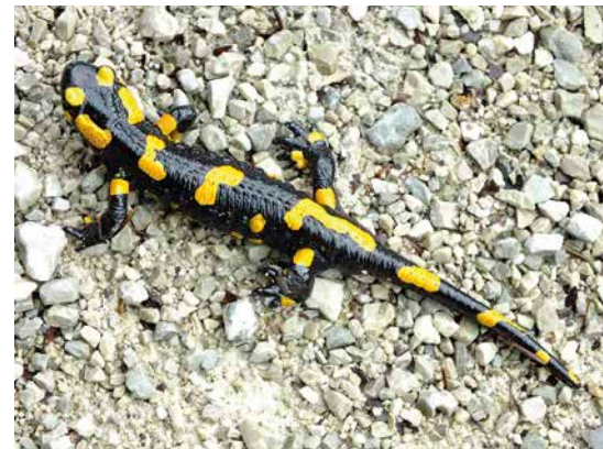
2 Die Unterart S. s. salamandra hat unregelmäßig geformte gelbe Flecken. Sie kommt vom Balkan bis in den Südosten Deutschlands vor.

Der Feuersalamander ist von allen einheimischen Lurcharten am stärksten an den Wald und hierbei vor allem an Buchen- und Buchenmischwälder gebunden. Er kann bei uns geradezu als Charaktertier des Buchenwaldes bezeichnet werden. Er kommt aber auch in anderen Laubwäldern, vor allem in laubholzreichen Schluchtwäldern, vor. Da er größere Laubwaldgebiete bevorzugt, ist seine regional unterschiedliche Verbreitung in Bayern verständlich. Während er in manchen Regionen, zum Beispiel Spessart (Malkmus 2009), Steigerwald und in der nördlichen Frankenalb keineswegs selten ist, tritt er im Tertiären Hügelland und in weiten Teilen der Oberpfalz nur noch punktuell auf. Auch neuere Erfassungen im Frankenalb zeigen, dass sich dort in den letzten Jahrzehnten deutliche Bestandseinbußen ergeben haben (Beyer 2016). Neben dem Sommerlebensraum in feucht-kühlen