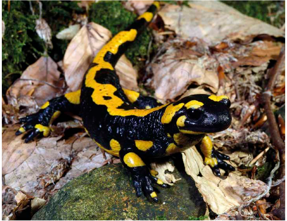
1 Der Feuersalamander ist in Buchen- und Buchenmischwäldern zuhause.

land vermischen sich diese beiden Unterarten in einer breiten Überlappungszone, die von Nordhessen über Nordbayern bis nach Sachsen reicht.